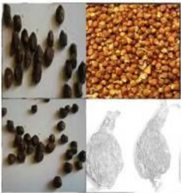
Aframomum melegueta ( aphro, tonique, antibiotique, etc)

Français : Maniguette, graine du paradis, Yorouba : atare, Anglais : alligator pepper, Baoule : saa, Goun et Fon : atakoun.