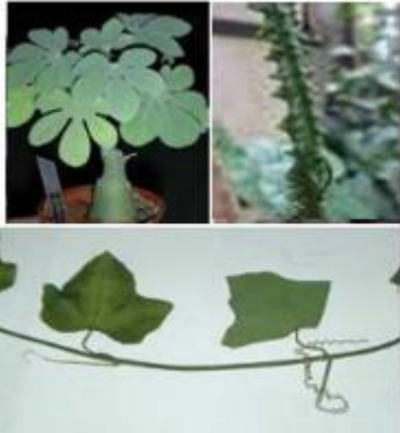
Adenia lobata( aphro,tonique, analgésique, etc)